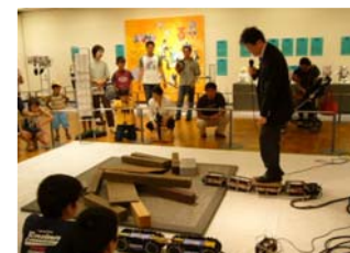
稼動ロボット紹介