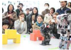
ロボットショーの様子