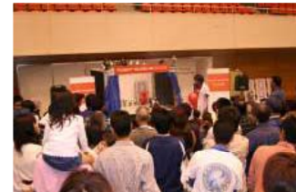
稼動ロボット紹介