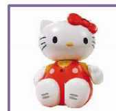
ハローキティロボ