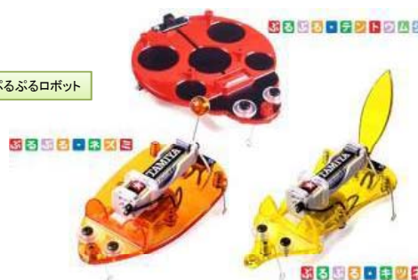
ぶるぶるロボット

■11:00-12:00 / 13:00-14:00 / 15:00-16:00の各1時間 x 3回の開催。