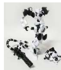
アソブロック(完成形)

■CLAYTOWN CLAYTOWNは、立体アニメーションを作る・撮る・見る楽しみを実感できるコマ撮りアニメソフト。キャラクターを作る、動かしながら撮影する、撮影後すぐ再生。USB接続PC用WEBカメラが必要です。