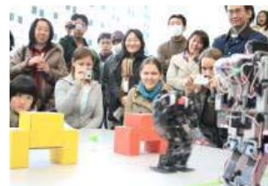
過去のイベント風景